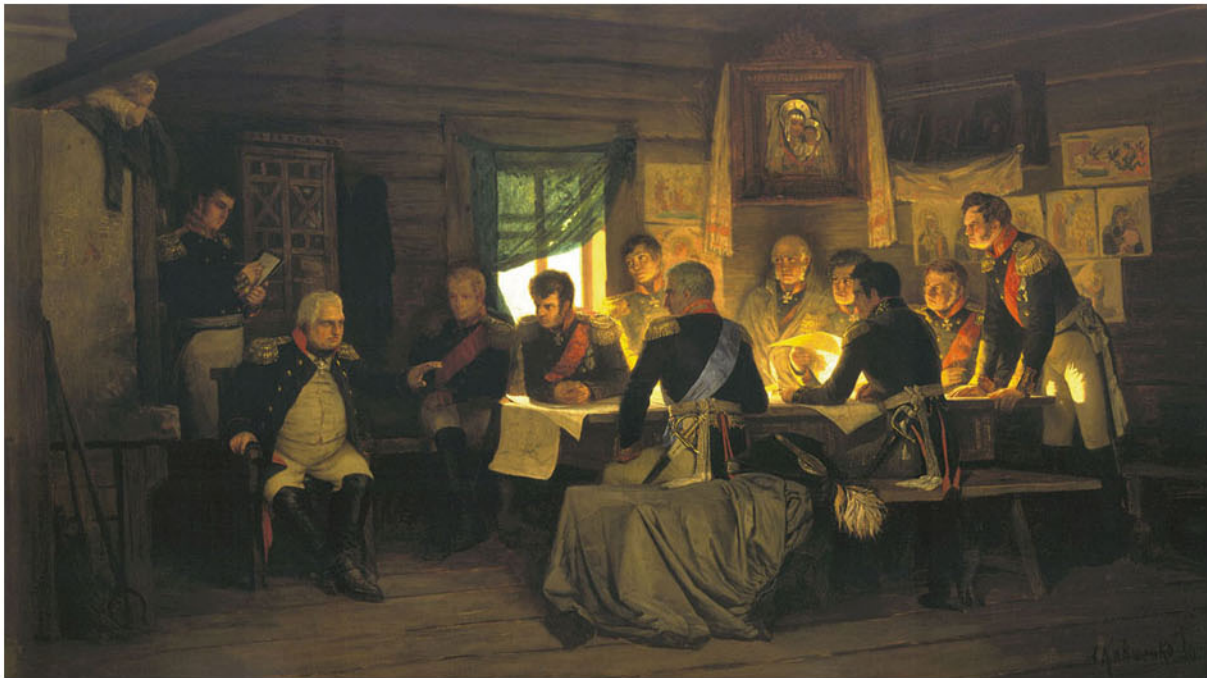
Кившенко А.Д. Военный совет в Филях в 1812 году. 1880

После Бородинского сражения русская армия отошла к Москве и ранним утром 1 (13) сентября расположилась у небольшой подмосковной деревни Филя. Вечером того же дня в крестьянской избе собрался военный совет во главе с командующим русской армией Михаилом Илларионовичем Кутузовым, на котором надо было решить судьбу Москвы. Отступать или дать ещё одно сражение? Мнения членов военного совета разделились.