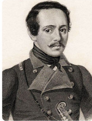
Михаил Юрьевич Лермонтов (1814–1841)