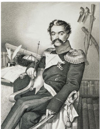
Гамтельн К.К. Денис Давыдов. Партизан 1812 года. Гравюра с акварели. 1820-е

В русской поэзии немало строк посвящено событиям и героям Отечественной войны 1812 года. Эти строки написаны участниками тех событий (Денисом Васильевичем Давыдовым), их современниками, а также представителями последующих поколений.