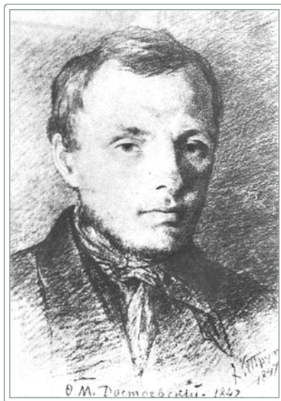
Фёдор Михайлович Достоевский