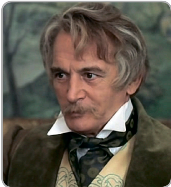
Василий Лановой в роли помещика Ивана Петровича Берестова

Соответствует ли экранный персонаж вашему представлению о герое? Запишите свои впечатления.