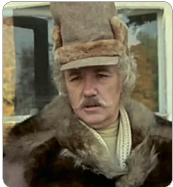
Леонид Куравлёв в роли помещика Григория Ивановича Муромского